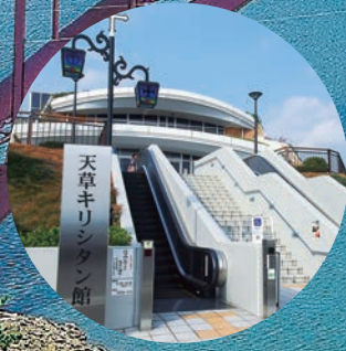
天草キリシタン館